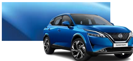
Niebieski - RCF