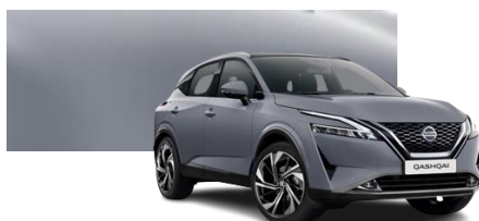
Szary ceramiczny - KBY