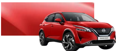
Czerwony - Z10