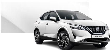
Biały perłowy - QAB