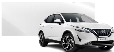
Biały - 326