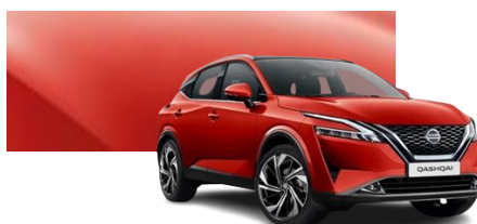
Czerwony Fuji Sunset - NBV