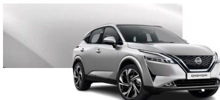
Srebrny - KY0