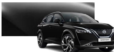
Czarny - Z11