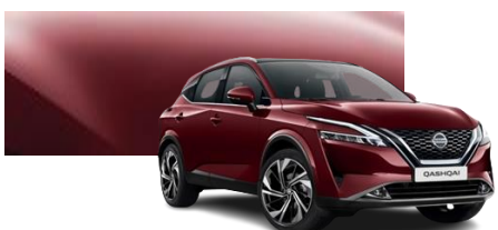
Burgundowy - NBQ