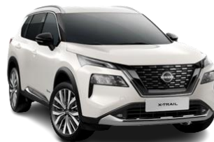
Biały perłowy - QAB