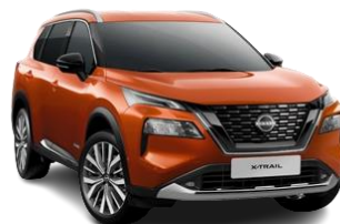
Pomarańczowy - EBL