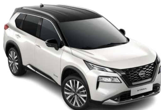
Biały perłowy + Czarny dach - XBJ