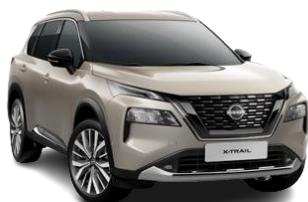
Szampański - KAY