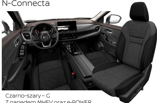
Czarno-szary – G Z napędem MHEV oraz e-POWER