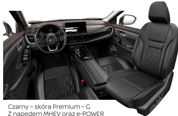
Czarny – skóra Premium – G Z napędem MHEV oraz e-POWER