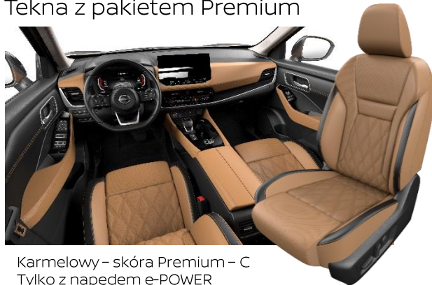
Karmelowy – skóra Premium – C Tylko z napędem e-POWER