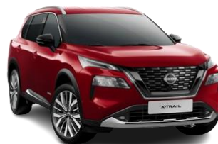
Czerwony - NBL