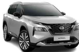
Srebrny - K23