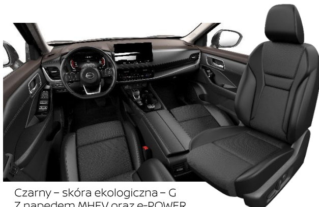
Czarny – skóra ekologiczna – G Z napędem MHEV oraz e-POWER