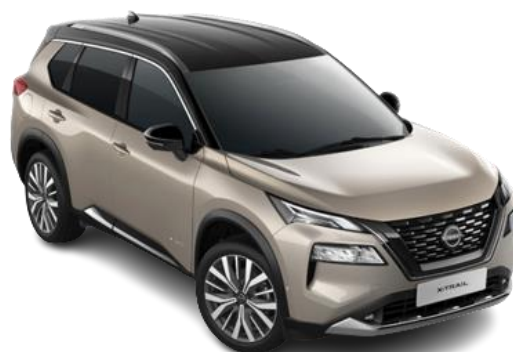
Szampański + Czarny dach - XEW