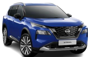
Niebieski - RBY