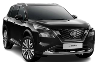
Czarny perłowy - G41