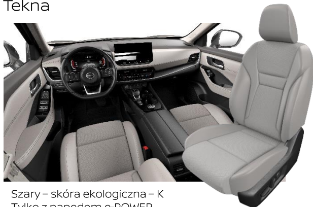
Szary – skóra ekologiczna – K Tylko z napędem e-POWER