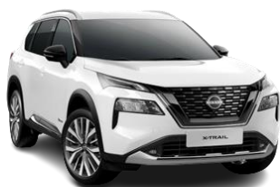
Biały - QAK