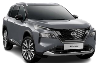
Ceramiczny szary - KBY