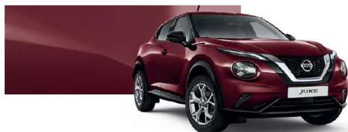
Burgundowy - NBQ