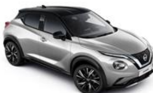
Srebrny + Czarny dach - XDR Personalizacja wnętrza N-Design: B