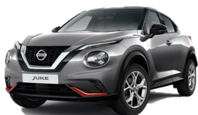
Miejski pakiet pomarańczowy