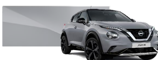
Szary ceramiczny - KBY