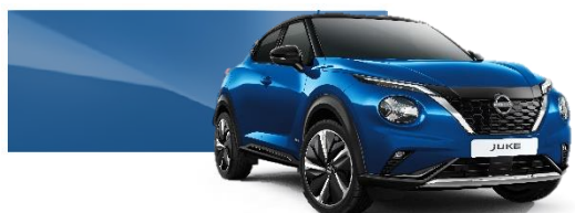
Niebieski - RCF