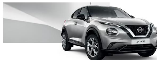
Srebrny - KYO