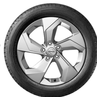
17" srebrna felga aluminiowa