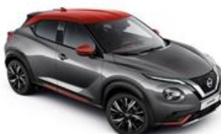
Szary + Czerwony Fuji Sunset dach - XFB Personalizacja wnętrza N-Design: B